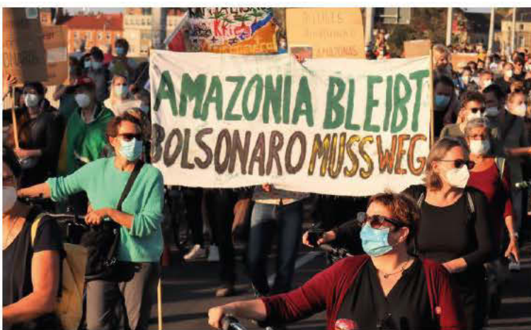
Bei einer Demo von „Fridays For Future“ in Mannheim

Stoppt die Rodung! Stoppt die Brände! Bindet Bolsonaros Hände!