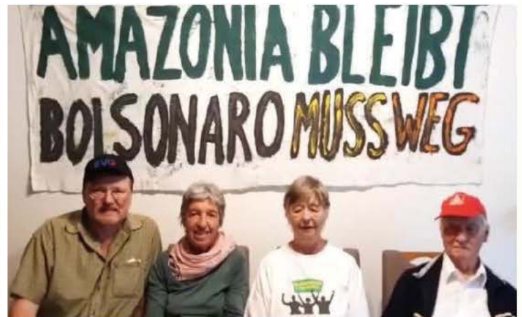
Aus einem Video zur Unterstützung einer Aktion in Brasilien