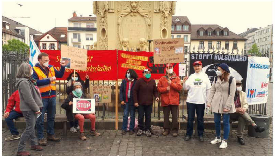
Der Arbeitskreis am 1. Mai 21 in Mannheim

Gemeinsamer Kampf für Klimaschutz, für eine neue Regierung in Brasilien: für mehr Demo- kratie und soziale Rechte