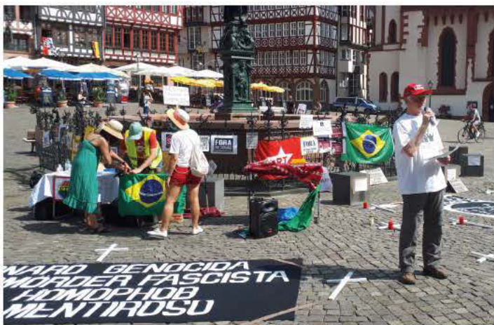
Bei einer Kundgebung in Frankfurt gegen Bolsonaro