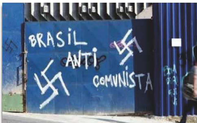
"Schmiererei an Wänden, Sprüche und Nazi-Symbole gehören zum brasilianischen Alltag"

Ein Bericht der Zeitung „O Globo“ zeigt, dass die Zahl der Beschwerden über die Aktionen von Neonazis in einem Jahr zwischen 5 und 20 lag. Seit Bolsonaros Machtübernahme sind die Straftaten mit faschistischen Hintergründen jedoch alarmierend gestiegen und haben 110 Fälle erreicht, das heißt, einen Fall alle drei Tage. Die Bundespolizei rechnet in den kommenden Jahren mit noch stärkerem Wachstum.