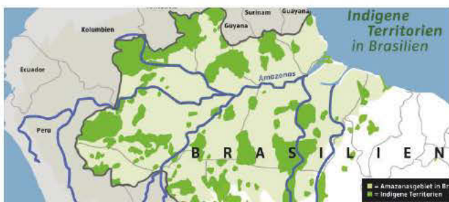
Grün sind die Indigenen-Territorien

Bolsonaro begründet das Vorhaben mit dem Krieg in der Ukraine. Dadurch drohe eine Knappheit von Kaliumdünger, was den Anbau von Soja, Zuckerrohr oder Kaffee gefährde.