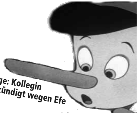
Lüge: Kollegin gekündigt wegen Efe

Wenn Daimler in Marienfelde Jobs vernichten will, dann ändern sich auch die Charaktere der E4er. So muss wohl das Verhalten des E4er in Bau 24 verstanden werden: Er setzt alles daran, kritische Betriebsratsarbeit zu verhindern.